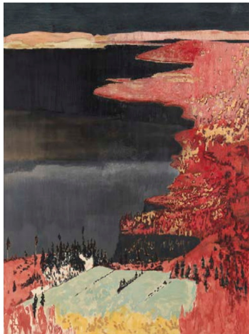
Dagen efter / The Day After, 2020. Olja på duk, 228x168 cm.