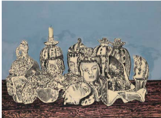
Hasch Hisch, 2020. Olja och kol på duk, 168x228 cm.

–Då började jag känna mig mycket mer stadig i skorna. Jag kände mig inte alls darrig utan gjorde den med någon typ av stolthet. Men man är aldrig starkare än sitt senaste verk. Självsäkerheten är inte bestående, utan flyktig. Den kan väldigt lätt få sig en törn och så åker man ner i backen.