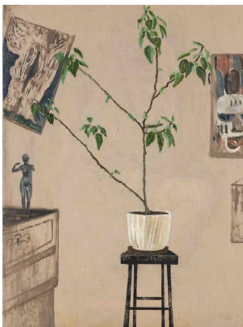
The Lost Paradise II, 2020. Olja och akryl på duk, 105.4x80.3 cm.

Thomas Bernard just för mörkret, för svärtans skull.