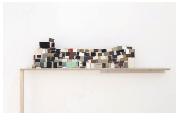
Bakom lås och bås, 2012. Tändsticksaskar, papp, papper, vattenfärg, färgkrita.