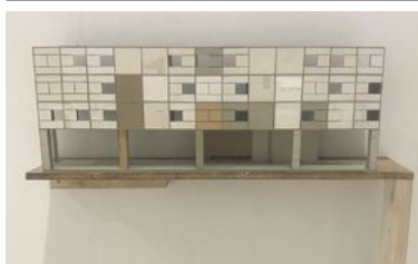
Grundskola 2008. Papp, papper, krita, blyerts, vattenfärg.

ETT HUVUDEMA I HANS KONSTNÄRSKAP ÄR FÖRKÄRLEKEN FÖR KOLLAGET SOM MEDIUM.