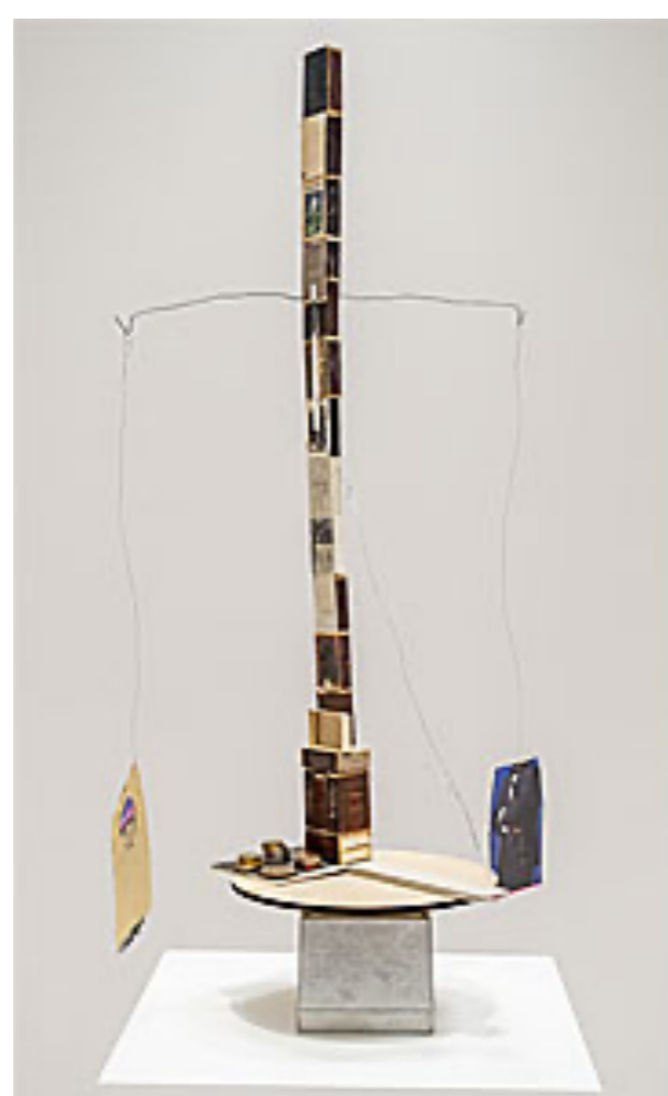
Stora salen , rörlig skulptur, 2021 © Jockum Nordström (Klicka på bilden för hög upplösning)