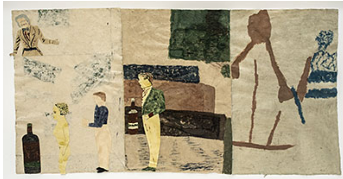
Installationsvy © Jockum Nordström (Klicka på bilden för hög upplösning)

Det är lätt att särskilt förtjusas av dessa nya mobiler som torde vara teknikernas skräck att söka hålla vid liv under hela utställningsperioden. Den kommer de nog överleva och tåla många pedalt tramp till mekanismen i podierna som håller styr på den fragila poesin av ljud, mynt, strängar och papp samt en och annan glasflaska, vinglande på sitt luffararbets-stativ av kemtvättsgalgar. Det är dock en poäng att verken ser ut att kunna rasa ihop vilken sekund som helst. Konst behöver få vara hisnande och det lyckas Jockum Nordström särdeles väl med i dessa mobiler.