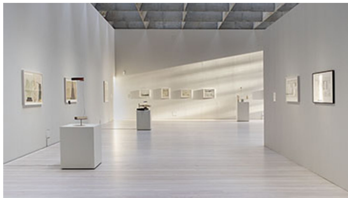
Installationsvy © Jockum Nordström (Klicka på bilden för hög upplösning)

Det är femton år sedan jag skrev sist om Jockum Nordströms verk, nästan en generation konstnärer har passerat. Det är en smula hisnande det också. För på något vis är tiden frusen i mötet med särskilt teckningarna. De första fem åren på 2000-talet var vurmen speciellt bland yngre konstnärer och konststudenter massiv inför detta direkta, stillösa tecknande som egentligen bara pågår, som en nödvändighet man känner igen som barnets. Nordström fortsatte och fortsätter att i som det verkar rasande fart fylla sina rutor med en för tecknaren fortsatt överraskande innehåll. Kanske har jag tjugo år senare lite svårare att uppfatta den spänningen, men det är gnäll man kan kosta på sig inför ett stort konstnärskap.