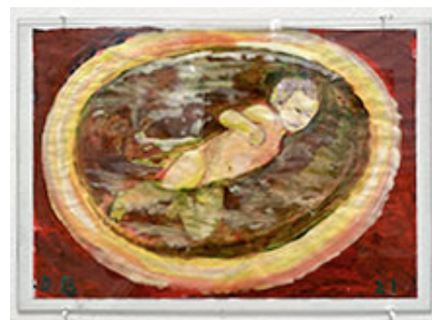
Första badet