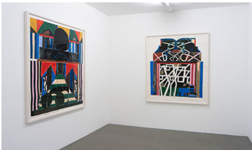
Installationsvy © EKTA