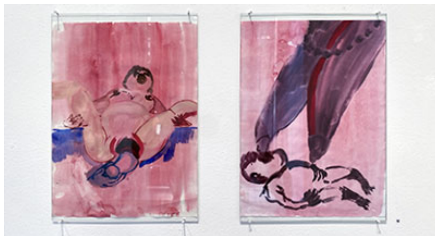
Lektion i samliv, diptyk