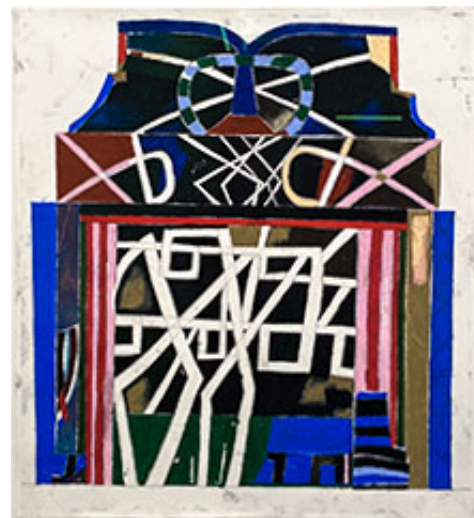
Skapelsens krona © EKTA

Samtidigt drar jag paralleller till Jockum Nordströms modernistiska lådkonstruktioner som jag själv tidigare recenserat . I såväl Nordströms som EKTA:s verk finns ett slags pusselaktigt bildbyggande där form och symbolspråk blir till rebusar karakteriserade av ett säreget kritstrecksspråk. Allra tydligast blir kopplingen i den serie målningar av hus som till skillnad från kyrktakens snirkliga formspråk är raka och enkla. De närmar sig också allra mest barnteckningens formspråk. Igenkänningen i hur man krampaktigt greppade tag om sina vaxkritor i barndomen känns tydligt i de färgfält som upptar arken.