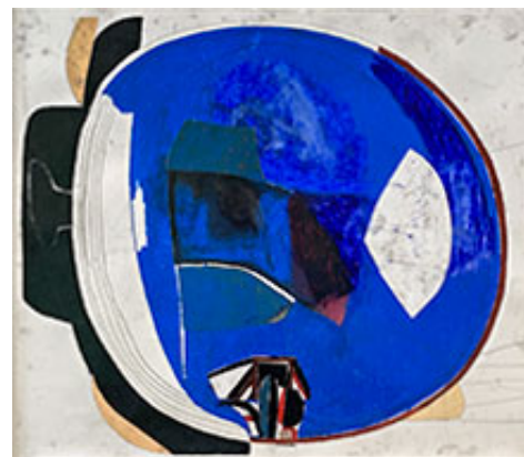
Yttermättet för en väldefinierad gränslinje

EKTAs arbetsprocess beskrivs i utställningstexten av konstnärskollegan Patrik Bengtsson, en för övrigt välskriven text som inte följer den typiska mallen för utställningstexter. Likt Matisse tejpar EKTA fast sina kriterier på långa stavar och tecknar upp sina verk på stora ark liggandes på ateljégolvet, gärna flera samtidigt. Det är ett arbetssätt som ger en viss kontrollförlust och element av slump. Spår av skoavtryck vittnar om hur konstnären rört sig runt och över bilderna genom processen. Andra moment vittnar om ett välplanerat arbete där urklippta delar placeras över arken, där de får pröva sin position innan de klistras fast och skapar nya bildelement. Det liknar inte Matisse Cut-outs , men likväl finns här en koppling till arbetssättet.