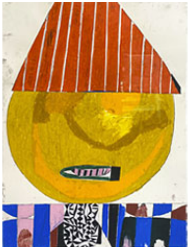
Magikern © EKTA