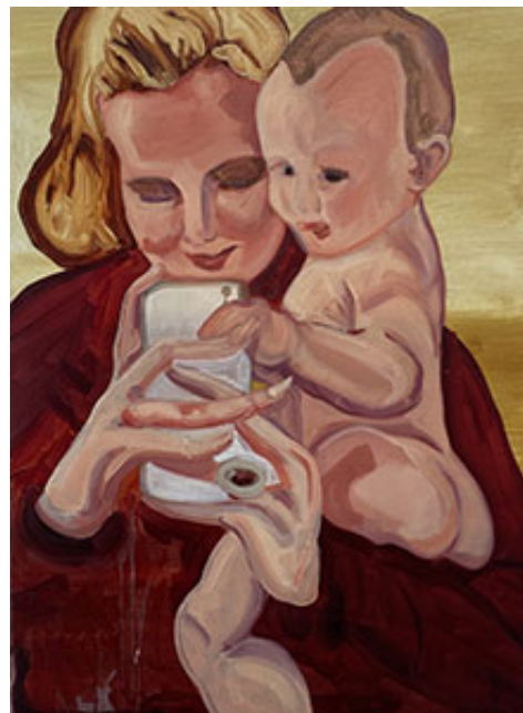
Sovande celler

Galleri Thomassen, Göteborg | Göteborgs Konstförening | Omkonsts startsida