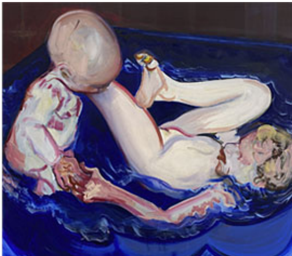
Ganska nära himlen