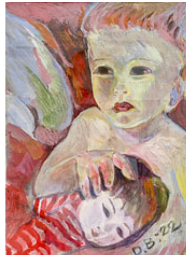
Koko © Duda Bebek