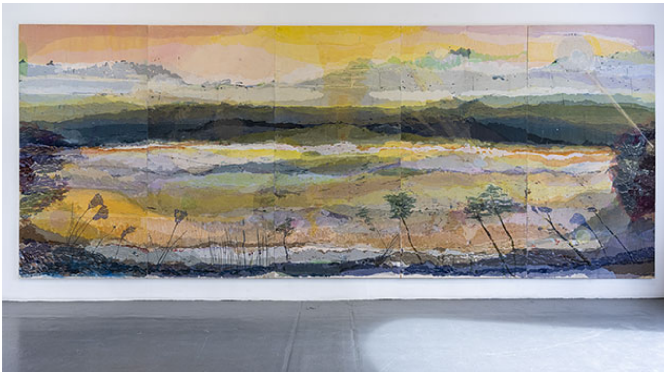
Aether , 2022, 240 x 580 cm, tyg, lim, pigment på pannå © Petra Lindholm (Klicka på bilden för hög upplösning)

Redan vid entrén lockas besökaren in av suggestiva men ändå relativt diskreta klanger, vilka strömmar ut från nästa rum. Filmen Transmissions , som ljudet kommer ifrån och som visas på en klassisk analog-tv, följer knappast logikens dramaturgi. Det handlar snarare om drömliknande efterbildsfenomen, likt de som uppstår när man sluter ögonen efter att ha bländats av solen. Det ständigt skiftande, abstrakta mönsterflödet löper fram med några få realistiska igenkänningsdetaljer, och oftast med cirkeln som samlande form.