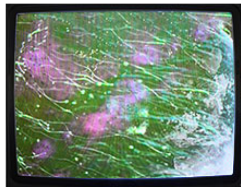
Transmissions , 2022, video och ljud © Petra Lindholm

Galleri Magnus Karlsson, Stockholm | Omkonsts startsida