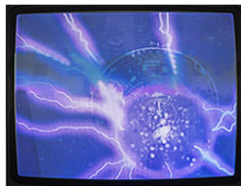
Transmissions , 2022, video och ljud © Petra Lindholm

De inspelade klangerna kommer från stämgaflar med olika tonhöjder vilka skapar interfererande ljudbilder och gradvisa tonförskjutningar. Det kan påminna om de repetitiva ljudstrukturer som länge intresserat minimalistiska kompositörer. Men i Petra Lindholms fall handlar det inte om musik i egentlig mening utan om ett sökande efter ljudmönster och klanger som kan interagera med filmens abstrakta ljus- och formspel.