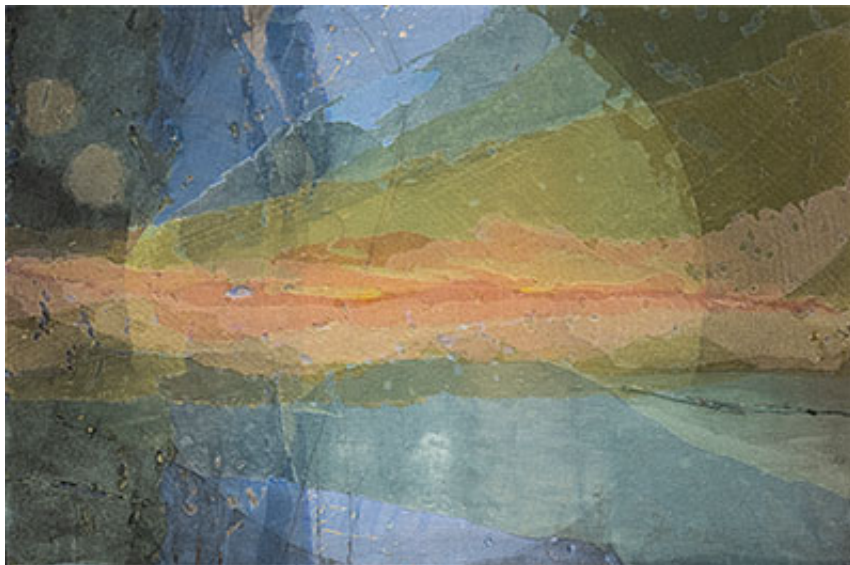
Gravity , 2022, 41 x 60,5 cm, tyg, lim, pigment på panna © Petra Lindholm

Utställningen i övrigt , med ett femtontal bilder i textil applikationsteknik, ansluter delvis till filmens tema. Men här är det ett mer lättigenkännligt formspråk som Petra Lindholm gör bruk av. Det generiska landskapet med sin lugnande horisont återkommer i samtliga fall. Det skapar en utställningsteknisk renhet, men är också en utmaning genom sin repetitiva karaktär. Cirkeln som solform, kikaröga eller ljuskägla gör dock sitt till för att skapa variation i den visuella helheten.