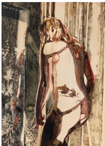
Sara-Vide Ericson, "Inner velocity VIII", 2022.

Läs en intervju med Sara-Vide Ericson på dn.se/kultur .